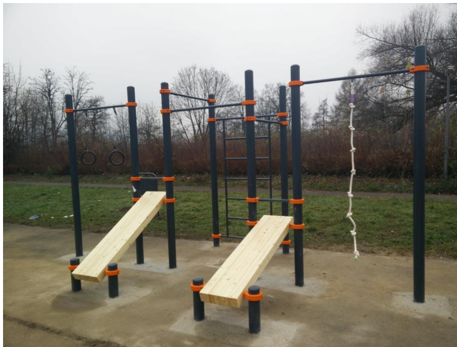
Slika 2: Simbolična slika postavitve dela fitnesa na prostem

Z omenjeno investicijo bomo popestrili športno dejavnost v občini Markovci in širše, saj se Športni park nahaja v bližini Ptujkega jezera, ki privablja tudi obiskovalce iz širše okolice.