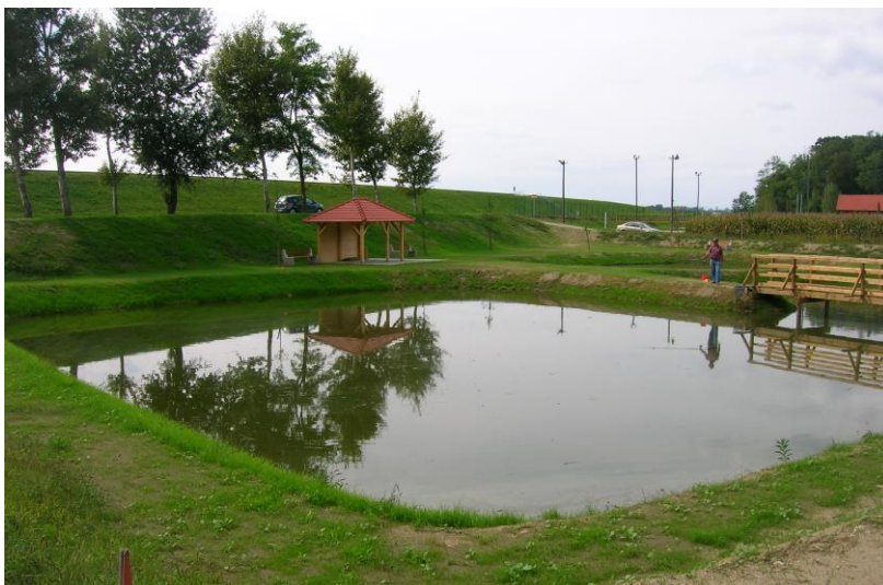
Slika 1: Prikaz območja Športnega parka Zabovci

V sklopu športnega parka Zabavci je tudi lično urejen ribnik za športni ribolov, ki je nastal v enem izmed mrtvih rokavov reke Drave.