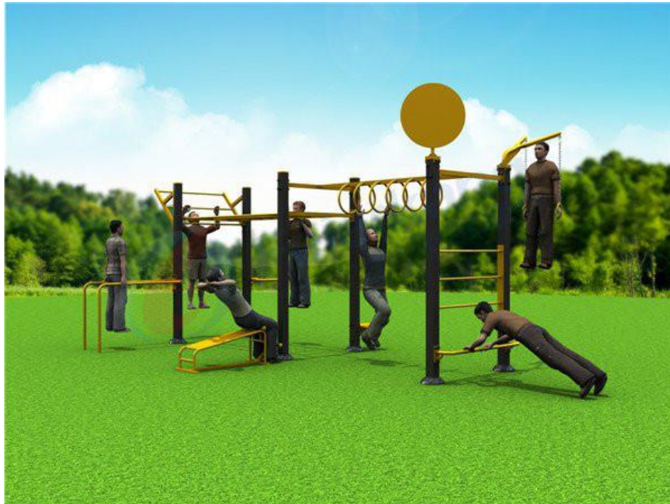
Slika 3. Simbolična slika postavitve dela fitnesa na prostem

Dobavila in postavila se bo zunanja oprema za telesno aktivnost, ki bo vključevala vsaj eno multifunkcijsko kompaktno enoto (Street Workout), na kateri bo omogočena osnovna vadba celotnega telesa. Multifunkcijska naprava bo omogočala vadbo za različne starostne skupine ljudi, kakor tudi za invalidne osebe. V sklopu multifunkcijske enote bo vgrajena vsaj ena fitnes naprava, za vadbo krepitev mišice celotnega telesa.