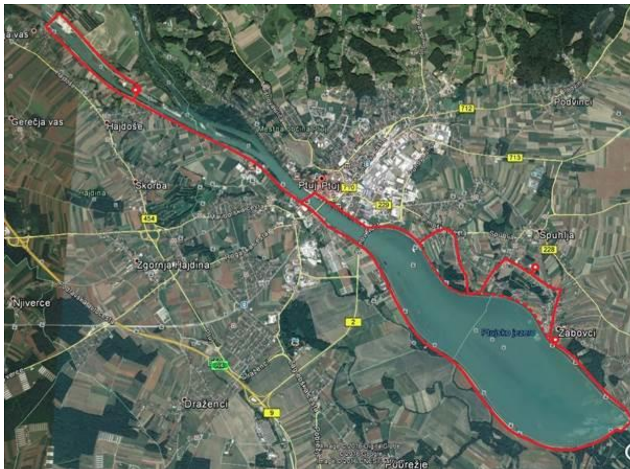
Slika 4: Potek krožne poti med tremi občinami (Hajdina, Ptuj in Markovci)

Poskrbeli bomo tudi za obveščanje ter informiranje občanov o nameščeni zunanji opremi z namenom, da jih čim več privabi k njeni uporabi. Občina bo tudi koordinator in povezovalec med vsemi javnimi zavodi, društvi in drugimi neprofitnimi organizacijami in jih bo spodbujala, da bodo k izvajanju svojih programov krepitev telesne aktivnosti dodala tudi aktivno uporabo nove zunanje opreme. Celotno območje športnega parka bo z izvedbo projekta tako dodatno urejeno in zasnovano za vse starostne skupine in invalide osebe.