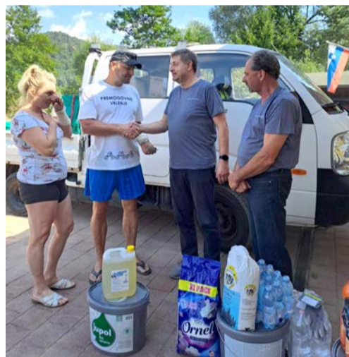
Prizadeti v poplavah so bili nadvse hvaležni pomoči, ki je prišla iz Občine Markovci