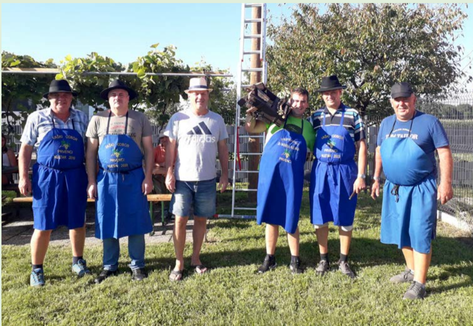
Postavitev klopotca v Prvencih