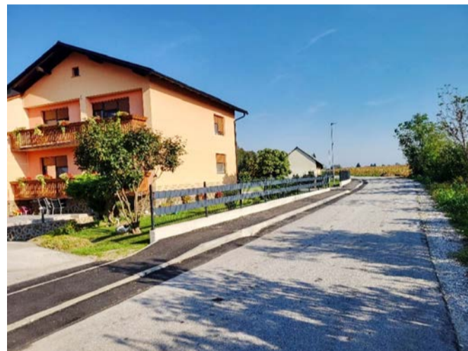
Pločnik ob JP 829081 v Stojncih