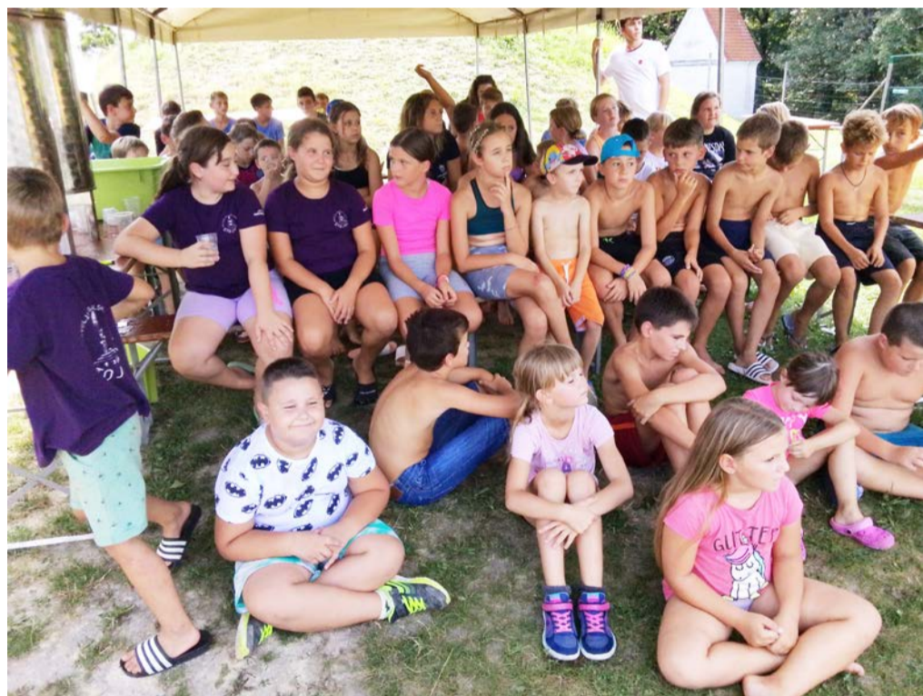
Taborniki so z zanimanjem poslušali predavanje