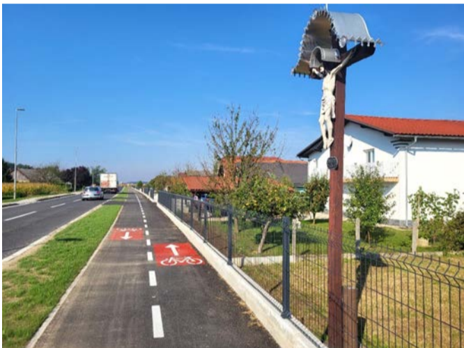
Kolesarska steza skozi naselje Borovci