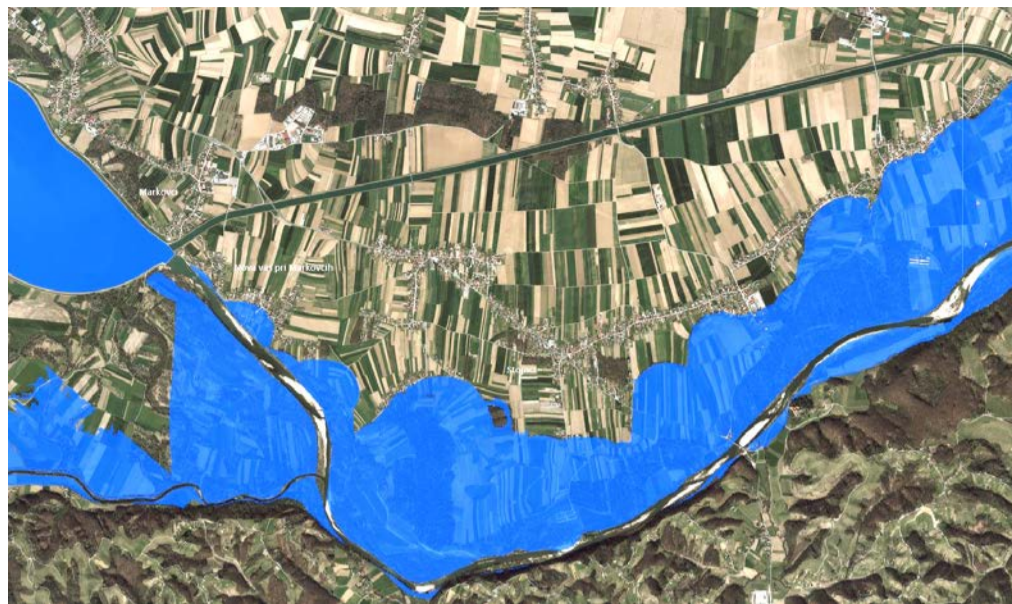
Območje dosega 100-letnih poplav

Glavni tok reke Drave se je vsako spomlad in jesen precej spreminjal. Leta 1928 je Markovčanom in Novovaščanom reka na veliko trgala rodovitno zemljo, ki so jo pred odnašanjem poskušali zavarovati z zabijanjem pilotov ob obrežju in