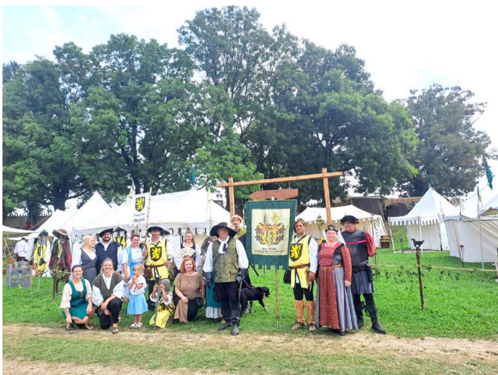
Baronovci pred taborom v Koprivnici