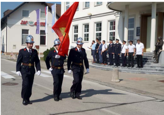
Gostje na častni tribuni so si ogledali gasilsko parado