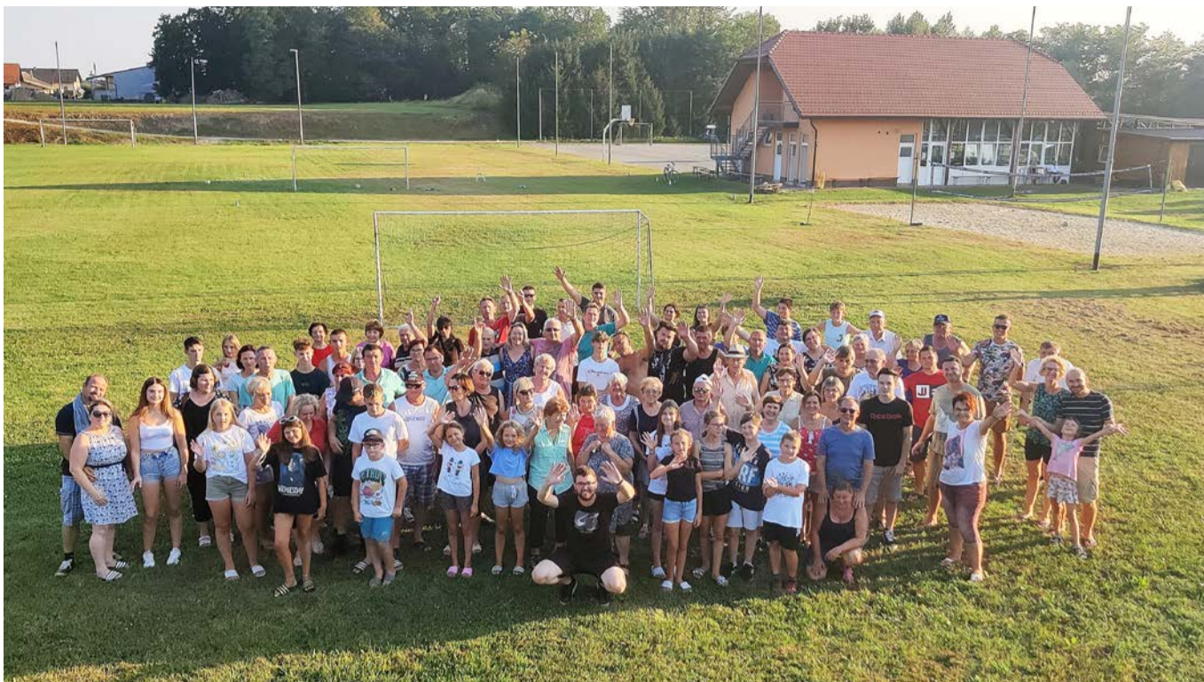
Udeleženci vaškega piknika v Borovcih

Skupno je zmagala ekipa Srednjega konca, drugo mesto je dosegla ekipa Spodnjega konca, tretje mesto pa si je priborila ekipa Zgornjega konca.