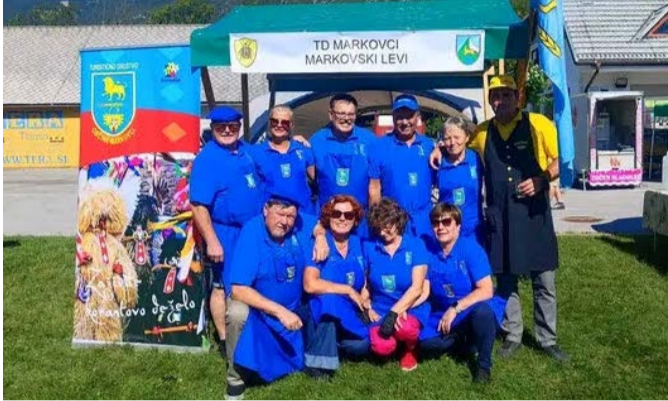
Člani turističnega društva na festivalu praženega krompirja v Bovcu

V soboto, 2. septembra 2023, je na letališču Bovec potekal tradicionalni 23. Svetovni festival praženega krompirja. Društvo praženega krompirja je festival organiziralo skupaj z Občino Bovec in Turističnim društvom Bovec.