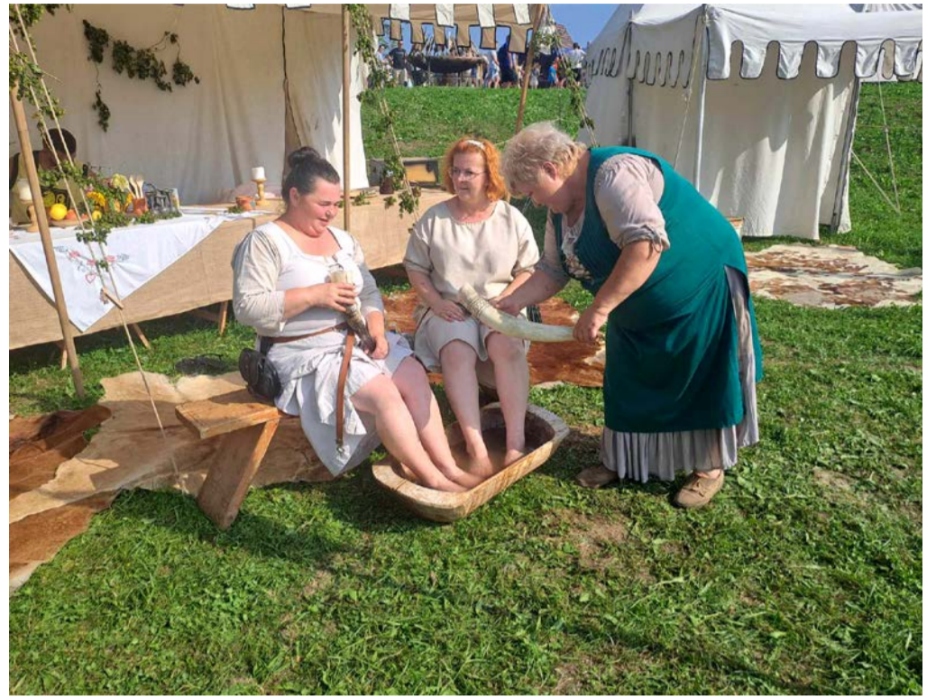
Animacije članic v Koprivnici

Naše društvo se je festivala udeležilo enajstič. Tam smo postavili tabor z devetimi šotori. Na prireditvi je bilo prisotnih naših 22 članov. Prikazali smo srednjeveško življenje v taboru, pranje perila, udeležili smo se povorke skozi mesto, naši člani so se udeležili igre srednjeveškega nogometa in večerne bitke. Poletje smo nadaljevali s sodelovanjem na srednjeveškem Vurberku. Prireditve je potekala v soboto 26. avgusta. Postavili smo dva šotora in predstavili Barona Markovskega. Perice so izvajale animacije pranja perila. September smo pričeli z gostovanjem v Bosni in Hercegovini. V petek 1. 9. smo odpotovali v Bosansko Gradiško. Tam smo postavili dva šotora in jih opremili v rimskem stilu. Potekal je namreč drugi festival Aventure. Predstavili smo življenje takratnih prebivalcev, bogatejšega sloja Rimljanov. Kot general »Lukulus« s svojim spremstvom smo bili prepoznavna točka na prireditvi. V petek 8. 9. smo na Ptujskem gradu pos-