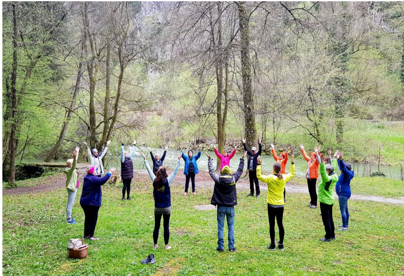
Vadba poteka v objemu narave