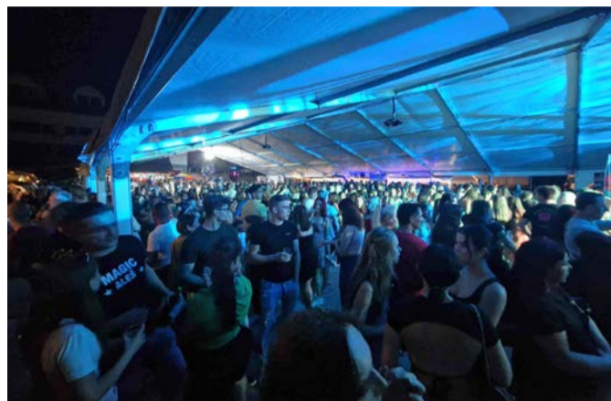
Čeprav je marsikdo bil skeptičen glede organizacije Markovske noči, je obisk presegel vsa pričakovanja organizatorjev

avtorji skušali zaobjeti tiste najpomembnejše in zanimive dogodke, ki so društvo zaznamovale v njegovih prvih stotih letih. Zbornik je zanimiv predvsem zato, ker vključuje številne dokumente in fotografije, ki nam brez besed pričajo o drugih časih in bralcu ponujajo, da s pomočjo lastne interpretacije ustvari podobo že preživetih časov.