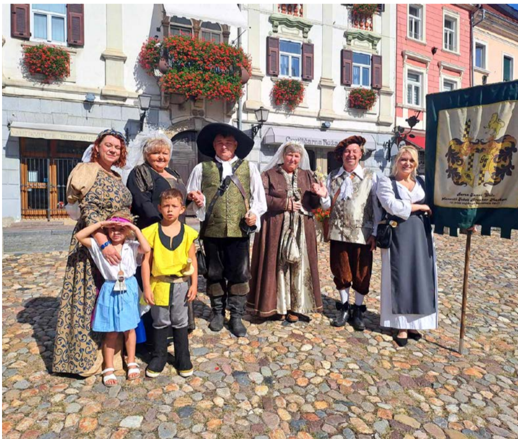
Baronovci na grajskih igrah na Ptuj