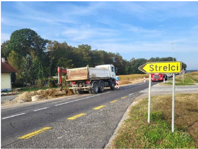
Gradbena dela ob Glavni cesti G-2 v naselju Strelci